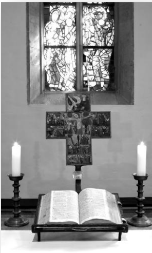
Das Altarkreuz von Eginow Weinert, darüber das Fenster von Walther Benner mit der Darstellung der Pfingstpredigt des Petrus – zwei Schätze der Kirche St. Peter zu Syburg

Den Vortrag zu den Farben der Kirchenfenster, der auf äußerst positive Resonanz stieß, werden wir zu einem späteren Zeitpunkt im Rahmen der „Montagsgespräche“ noch einmal anbieten – an einem Abend, an dem der Parkplatz nicht durch Kirmes und Casino rettungslos überfüllt ist.